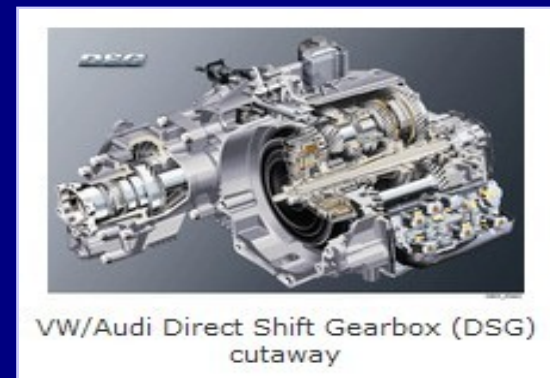
VW/Audi Direct Shift Gearbox (DSG) cutaway

耐久性能試験も行い、ノーマル時と同等の耐久性を維持することが確認されています。 また、TCU(トランスミッションコントロールユニット)へのプログラミングですので、ECUはノーマルの場合でも、またはチューニング済みの場合でも問題ありません。 また、他社製チューニングECUにも対応可能です。